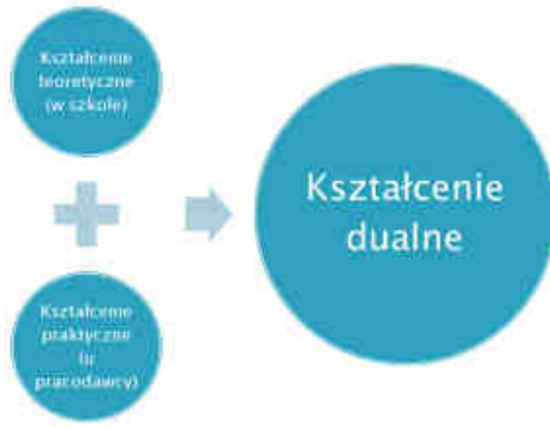
Rys. 1. Kształcenie dualne

Kształcenie dualne to połączenie kształcenia teoretycznego z kształceniem praktycznym w celu zastosowania i pogłębienia zdobytej wiedzy i umiejętności zawodowych w rzeczywistych warunkach pracy